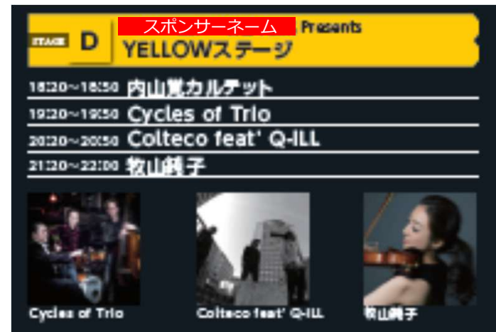
パンフレットタイムスケジュール サンプル